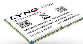
MobileTek SMART Module: Automotive